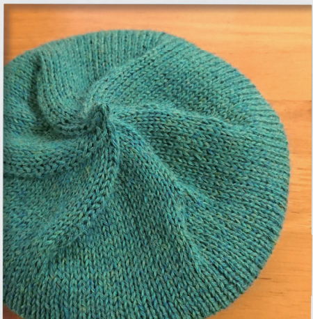
にくまん型のベレー帽子